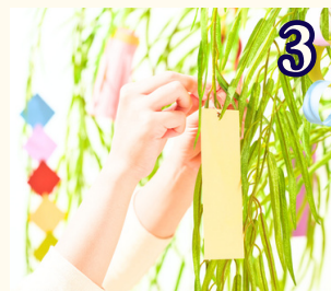
3 6月26日 (金) 七夕飾りをつくろう