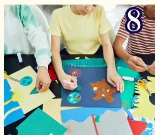
8 11月13日 (金) 作品展の作品づくり