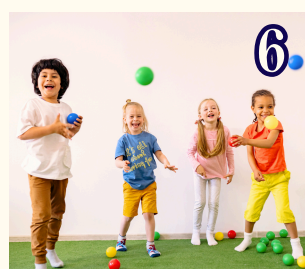
6 9月11日 (金) 体育あそび (運動会ごっこ)