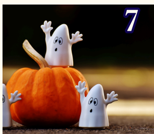
7 10月30日 (金) ハロウィン製作 仮装大会