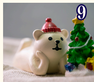
9 12月18日 (金) クリスマス会