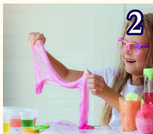
2 5月15日 (金) スライムであそぼう