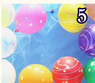
5 8月28日 (金) 夏まつり