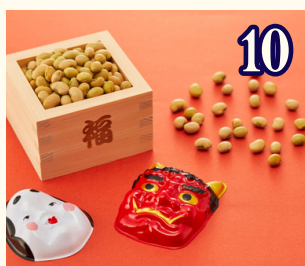
10 1月22日 (金) 豆まき 鬼のお面をつくろう