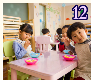
12 3月12日 (金) 幼稚園のお給食を 食べよう