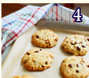
4 7月10日 (金) クッキーづくり