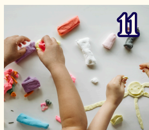
11 2月26日 (金) 小麦ねんどで あそぼう